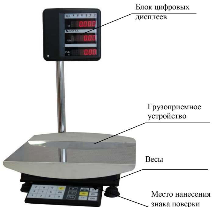
Рисунок 1. Весы ПВМ-3/6-Т, ПВМ-3/15-Т, ПВМ-3/32-Т. Внешний вид